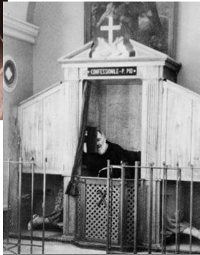
Confessionário do Padre Pio

Por muitas vezes ele passava de 10 à 15 horas ouvindo as confissões, e segundo os fieis, essas confissões eram a causa de grandes e verdadeiras conversões.