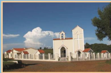
Complexo da Ermida de São Pio de Pietrelcina Faxinal do Soturno - Quarta Colônia Rio Grande do Sul - Brasil