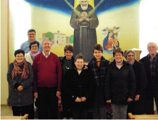
10 dos 12 participantes na celebração do dia 25 na Ermida